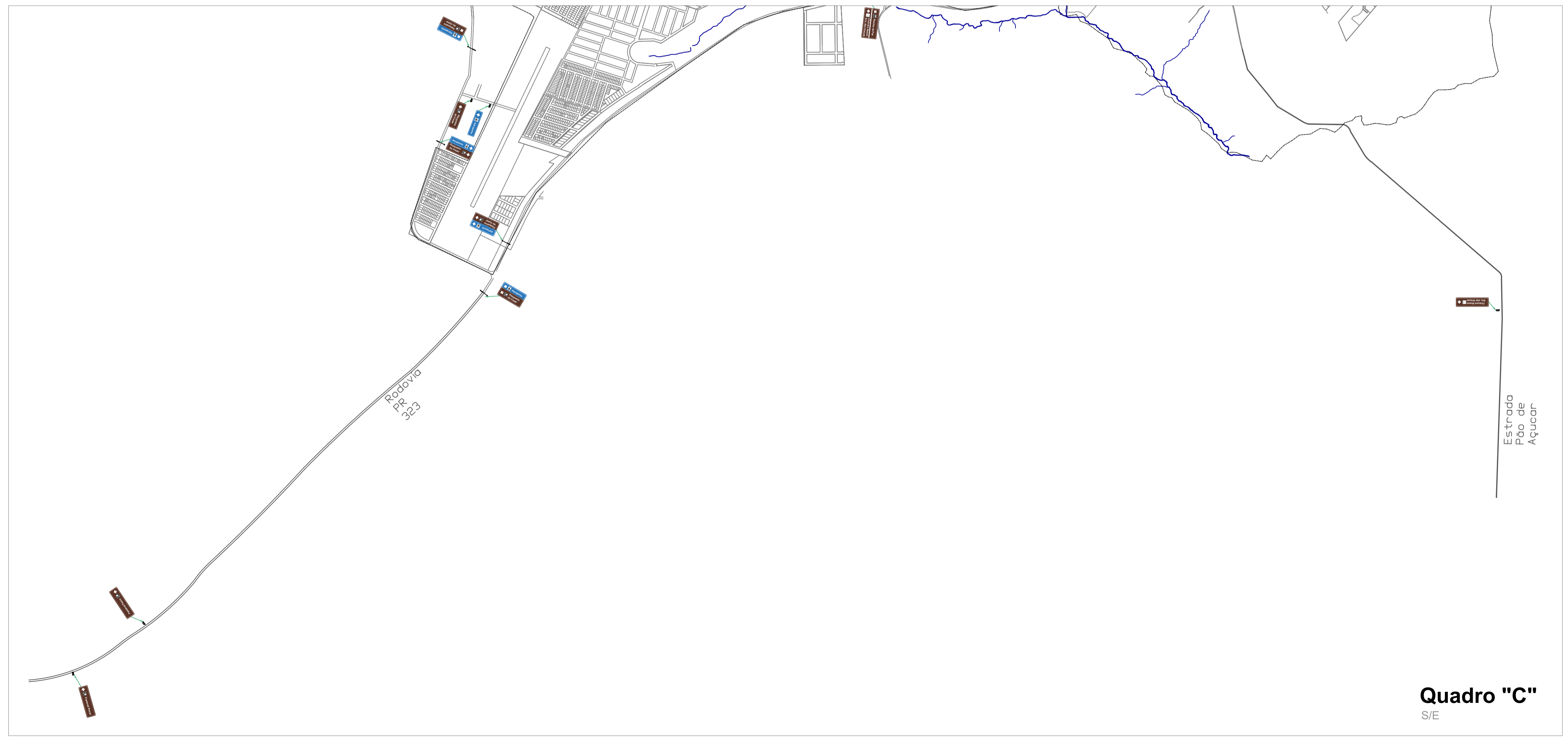
Quadro "C" S/E