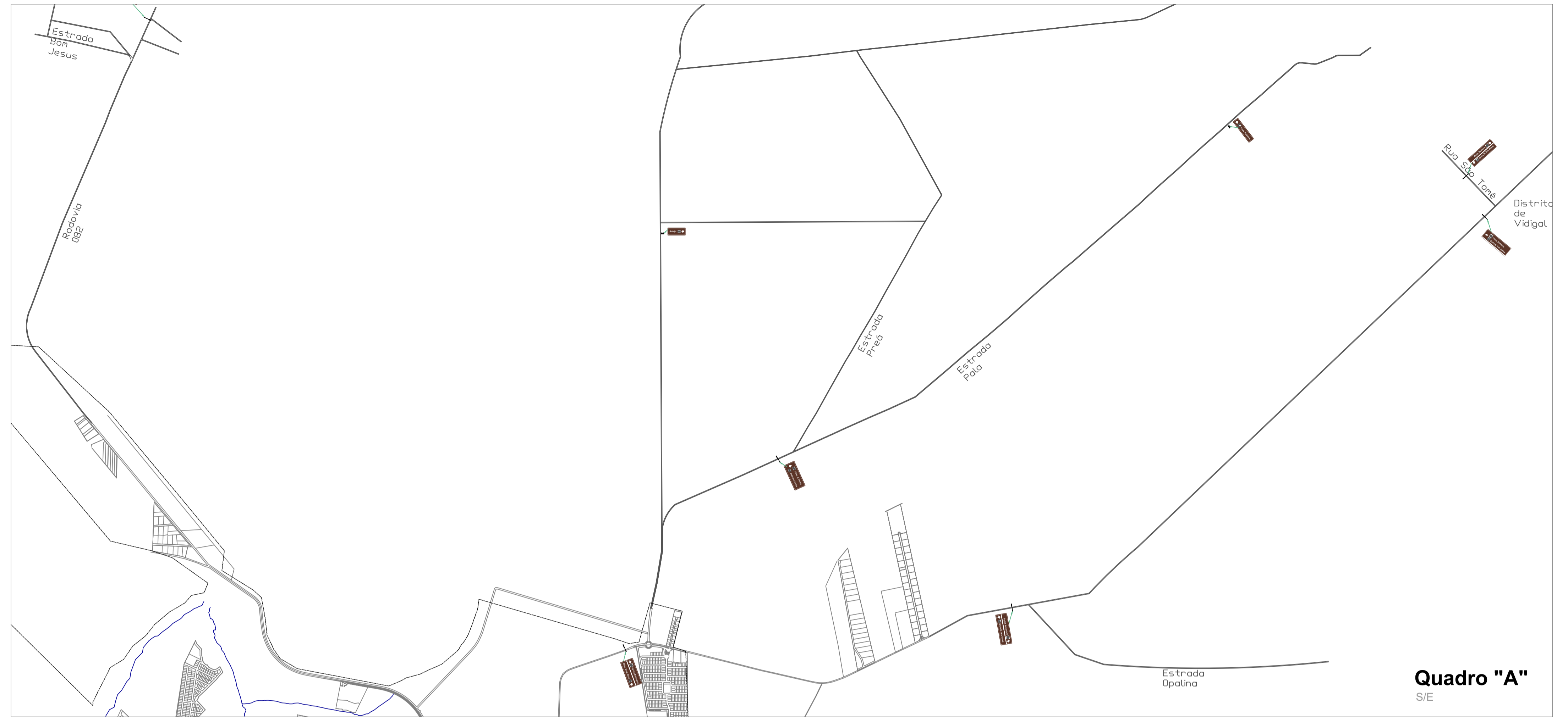
Quadro "A" S/E